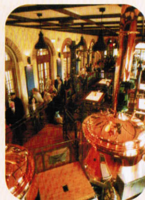
Braukessel aus dem Bayerischen Bahnhof. Brew tank in the Bayerische Bahnhof.