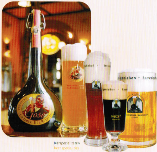
Bierspezialitäten beer specialties